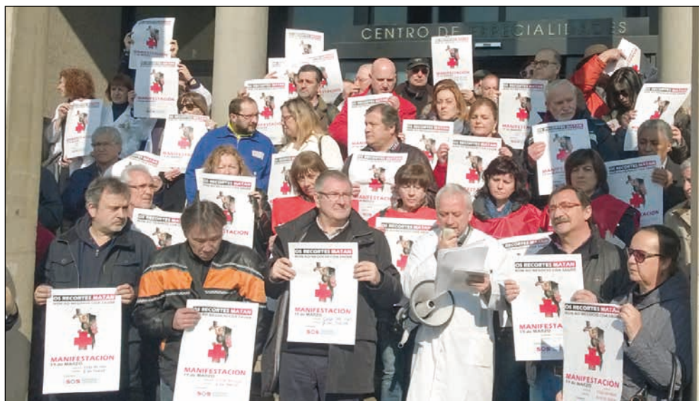
Usuarios/as e profesionais da sanidade pública están en pé de guerra contra as privatizacións.

Estas normas facilitarían o desembarco das empresas americanas, coas súas condicións, en Europa, saltando calquera