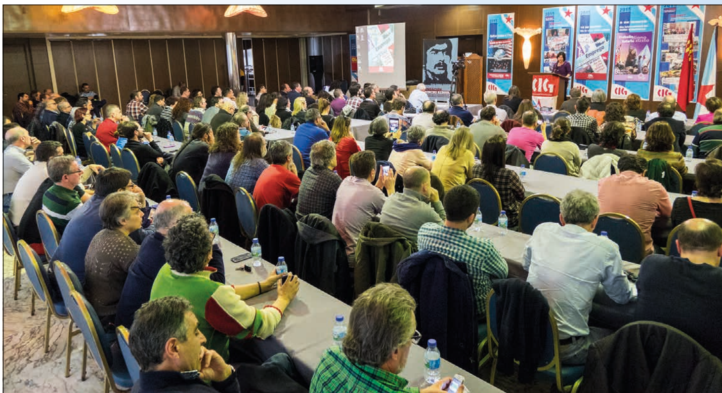
A entrega dos premios celebrouse tras a xuntanza do Consello Confederal. / TS