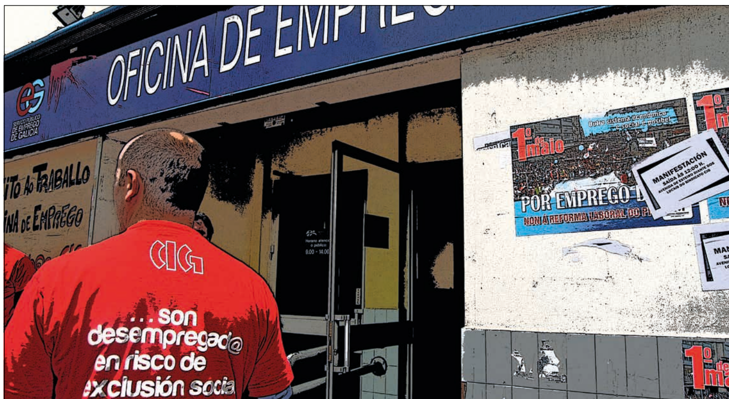
"Sabes que cada día que pasa é peor que o anterior e incluso tes medo de poder chegar a quedar na indixencia". / TS

tas os días que quedan para rematar a prestación. Sabes que cada día que pasa é peor que o anterior e incluso tes medo de poder chegar a quedar na indixencia. Tamén é moi duro escoitar os gurús económicos da televisión dicir que a xente da nosa idade non vai volver traballar. Que pensan facer connosco? Meternos en guetos? Gasearnos? Por iso é moi importante non perder a perspectiva e estar organizado, porque queren que quedemos na casa mentres destrúen a nosa forma de vida e converten este país nun ermo.