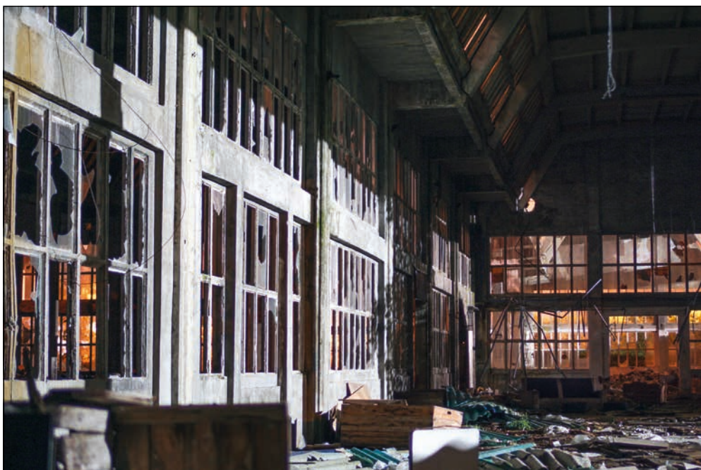
O ano 2014 pechou con 154.000 ocupados/as na industria, fronte aos 215.000 que había en 2008.

A perda de emprego foi constante neste período, pois aínda que experimentou unha leve suba nos anos 2011 e 2014, esta coincidiu cun aumento do número de persoas que decidiron darse de alta como autónomos. De feito, a cantidade de asalariados/as continuou en caída libre todos estes anos (dos 191.300 en 2008 aos 135.400 en 2014, o que supón unha baixada de 55.900 persoas asalariadas).