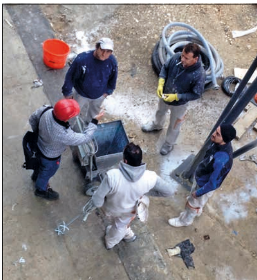
Os cambios na norma facilitan o negocio das ETT.

Instituíu de xeito masivo a precariedade, de maneira que os despedidos se producen con carácter xeral por causas obxectivas, con indemnización de 20 días por ano, tecnicamente irreversíbeis e sen posibilidades de readmisión; en definitiva o despedido libre, que pretende deixar a clase traballadora nun estado de indefensión sen capacidade de reclamación e resposta sindical.