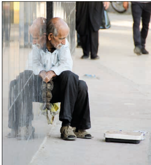
A crise económica está a provocar un empobrecemento xeneralizado da clase traballadora.

Segundo datos da propia Axencia Tributaria, o noso país conta na actualidade con 969.000 asalariados/as, dos que 301.000 (o 31%) ingresan menos do salario mínimo interprofesional (648