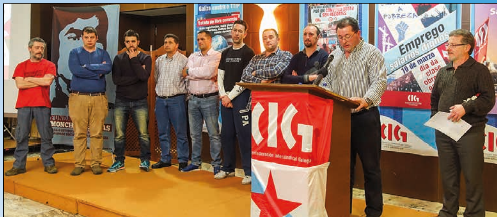
O persoal de Urbaser permaneceu 59 días en folga na defensa dun convenio colectivo digno. / TS

As dúas loitas tamén se caracterizaron porque as administracións titulares –concretamente o Concello de Lugo e o Ministerio de Defensa– obviaron a súa responsabilidade, permitindo ás empresas privadas que xestionan os servizos incumpriren os pregos de condicións, saltaren a normativa laboral e utilizaren os cartos dos e das contribuíntes para engordar os seus beneficios na mesma proporción que precarizan o emprego.