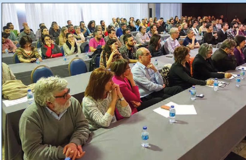
Ao acto asistiron representantes de organizacións políticas, sociais e culturais galegas.