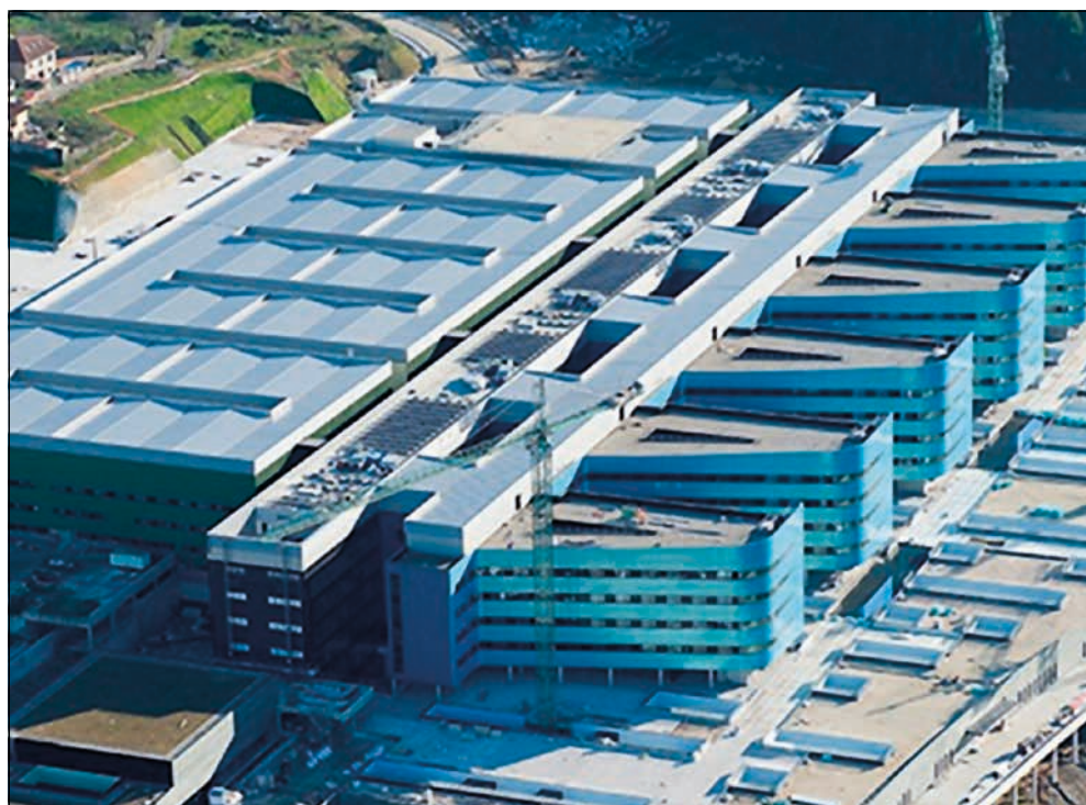
O novo hospital de Vigo está a ser un exemplo da privatización da xestión sanitaria.