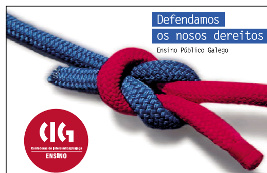
Imaxe usada na campaña electoral da CIG-Ensino.

do ensino público, os recortes e o ataque á nosa lingua e ao activismo para restituír os dereitos laborais e mellorar a calidade do ensino.