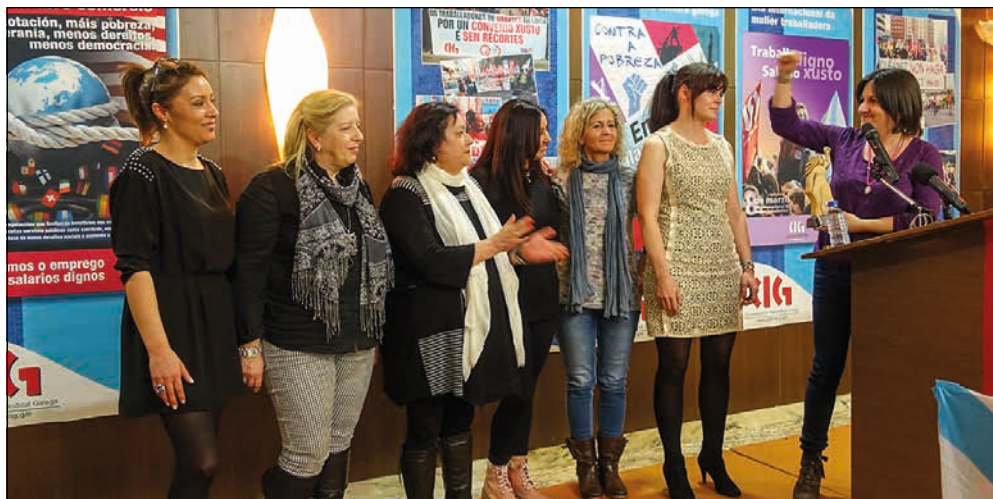
As traballadoras de Cleanet tiveron que ir á folga para cobrar os seus salarios.

No caso das traballadoras de Cleanet (encargadas da limpeza dos edificios militares), a loita referiuse a un dereito