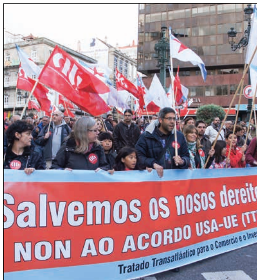
Imaxe da manifestación celebrada en Vigo.

Isto pon de manifesto outra das eivas: a redución da democracia a un envoltorio sen contido. Xa non é só que as