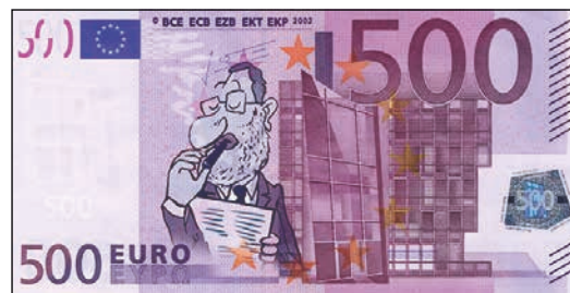
A reforma laboral beneficia o gran capital.

Ao facilitar as causas, o despido obxectivo xeneralízase, especialmente o individual pero tamén o colectivo, e as empresas conseguen un abaratamento de até un 80% respecto do persoal fixo, tanto maior canta máis antigüidade teñan. En vez de pagar 45 días por ano e un máximo de 42 mensualidades, ou 33 días/ano e un máxi-